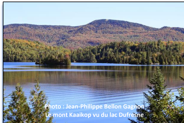
Le mont Kaaikop vu du lac Dufresne

Grâce à la volonté ferme de la Municipalité de Sainte-Lucie-des-Laurentides, membre de la Coalition, une injonction interlocutoire protège temporairement le Mont-Kaaikop des coupes de bois. Cette protection est limitée dans le temps et fera l'objet d'un débat sur le fond du litige en Cour supérieure du Québec.